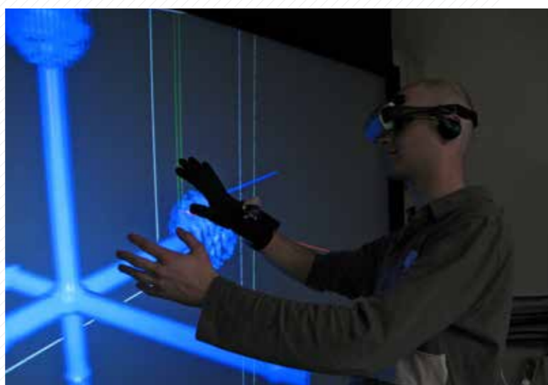
Práce se stereostěnou v laboratoři počítačové grafiky.