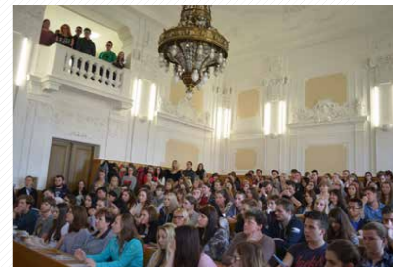
Studenti právnické fakulty.