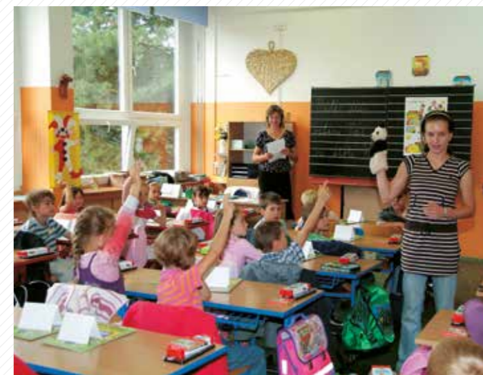
K přípravě učitelů patří také povinná praxe na školách.