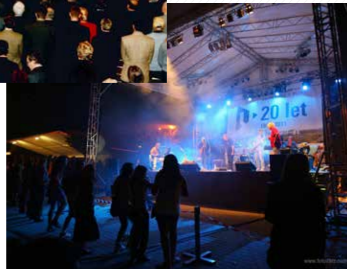
Oslavy 20. výročí založení Západočeské univerzity v Plzni.