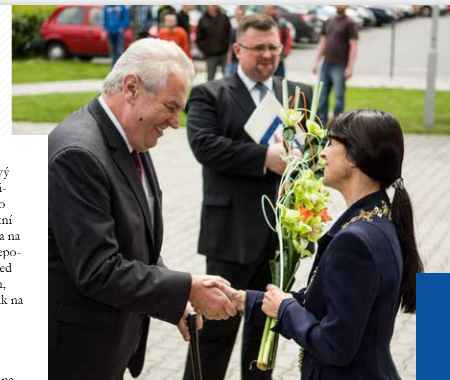
Návštěva prezidenta Miloše Zemana v roce 2014.

Západočeské univerzitě v Plzni přeji do dalších let nadané a zvědavé studenty, kvalitní pedagogy a špičkové vědecké pracovníky. Aby vzdělanost, bádání, svobodná akademická diskuse a utváření vztahu s vnějším prostředím spojovaly univerzitu v jednotný celek, významně a pozitivně ovlivňující život v regionu Plzeňského kraje a města Plzně. V neposlední řadě pak přeji univerzitě, aby absolventi svou alma mater podporovali a nosili ji v srdci. Ať spolupráce fakult a ústavů univerzity přinese významné postavení v ČR i v zahraničí.