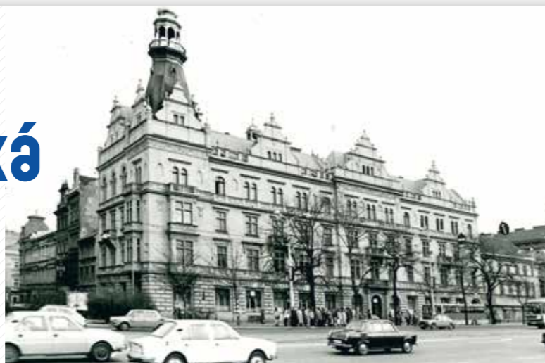
Fakulta elektrotechnická sídlila původně v centru Plzně, v sádkách Pětatřicátníků 14.

Fakulta realizuje základní i rozsáhlý aplikovaný výzkum, který má prokazatelný a významný vliv na praxi. Pracoviště má nezanedbatelný podíl na vývoji dopravních prostředků s elektrickým a hybridním pohonem (autobusy, trolejbusy, tramvaje, lokomotivy).