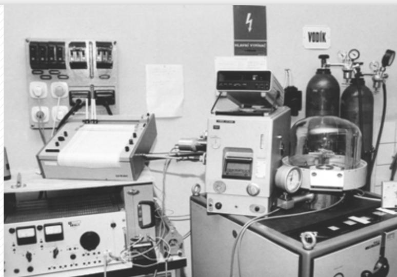
Z historie výpočetní techniky.

Fakulta se již od svého vzniku orientovala na propojení výuky s vědecko-výzkumnou činností, a proto díky vynikajícím výsledkům získala již v roce 1990 pět výzkumných záměrů, jejichž souhrnný finanční objem převýšil 120 milionů Kč. Fakultní prioritou bylo vždy vynikající a perspektivní personální zabezpečení všech pěstovaných oborů; v roce 2002 se podařilo dosáhnout vytyčeného cíle, aby na každé katedře působil alespoň jeden profesor ve věku do 50 let. V roce 2010 se podařilo získat dotaci z Evropského fondu pro regionální rozvoj na pořízení nových výukových prostor a na vybudování fakultního výzkumného centra mezinárodní úrovně. O čtyři roky později byl projekt NTIS úspěšně dokončen a fakulta odstartovala další etapu své existence v nových prostorách; součástí je kromě výukových kateder nově i fakultní pracoviště výzkumu a vývoje, tedy evropské centrum excelence NTIS – Nové technologie pro informační společnost.