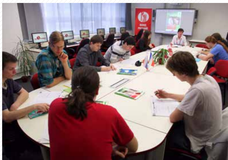
Výuka v Ruském centru.