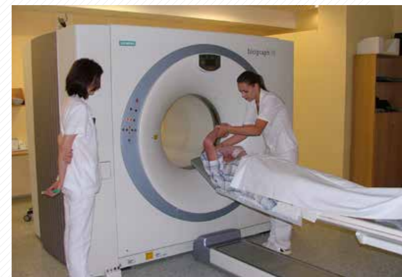
Studenti na praxi.