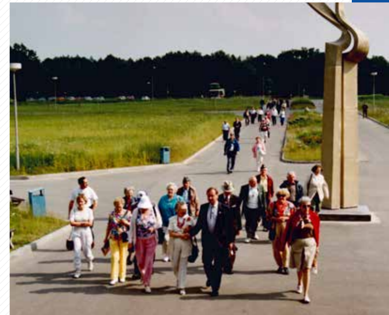
V roce 1994 navštívili univerzitu američtí veteráni.