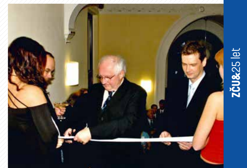
Slavnostní otevření zrekonstruované budovy fakulty právnické v sádkách Pětatřicátníků 14 v roce 2006.