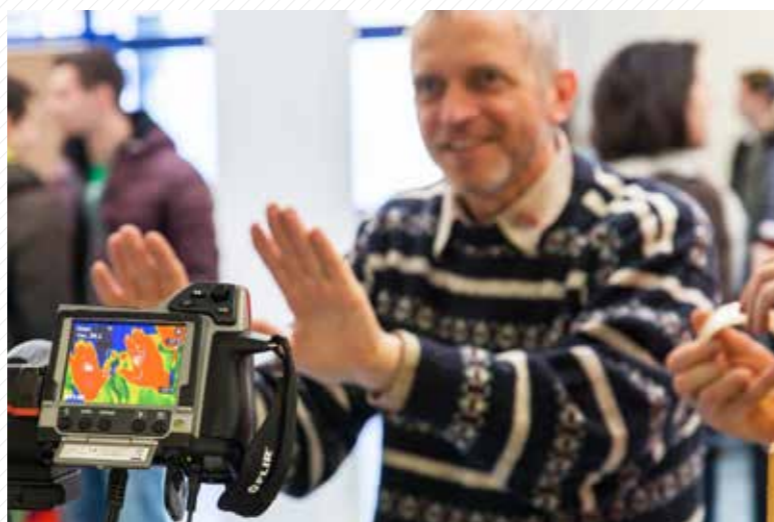
Obraz snímáný v infračerveném spektru (termokamera, termovize) při dnech otevřených dveří.