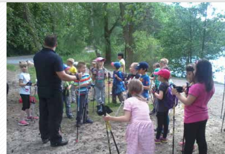
Škola zdravé chůze pro nejmenší.

Fakulta zdravotnických studií připravuje odborníky pro lůžkovou i ambulanci zdravotnická zařízení, privátní ošetrovatelské organizace, domácí a rodinnou péči, centra léčebné rehabilitace, lázně, léčebny, komunitní péči laboratoře. Fakulta rozvíjí spolupráci se zahraničím – spolupracuje velmi intenzivně s univerzitami, zdravotnickými zařízeními v Německu, s Bavorským červeným křížem, dále s vybranými univerzitami na Slovensku, v Polsku a v Rakousku. Postupně se také rozvíjí i spolupráce s univerzitou v partnerské čínské provincii HangShou. Fakulta má rovněž rozvinutou spolupráci s institucemi jako je např. EFRS (European Federation of Radiographer Societies), SRLA (Společnost radiologických asistentů), SÚJB (Státní úřad pro jadernou bezpečnost), UJV Praha-Řež (Ústav jaderného výzkumu), Ottobock. Fakulta se opakovaně umístila na předních místech při hlasování studentů o nejlepší fakultu roku a v roce 2011/2012 získala titul Fakulta roku.