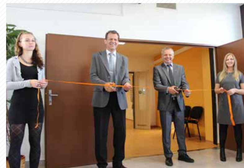
V září 2016 ekonomická fakulta slavnostně otevřela zrekonstruované prostory v univerzitním kampusu na Borech.