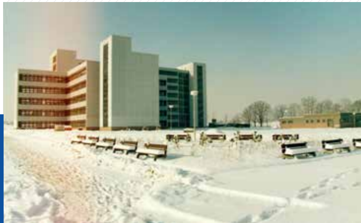
Univerzitní areál v devadesátých letech.