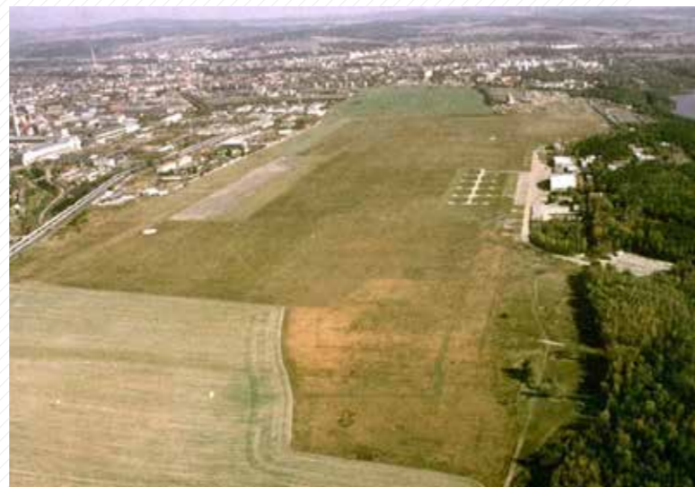
Letecký snímek Borských polí před začátkem výstavby univerzitního kampusu.