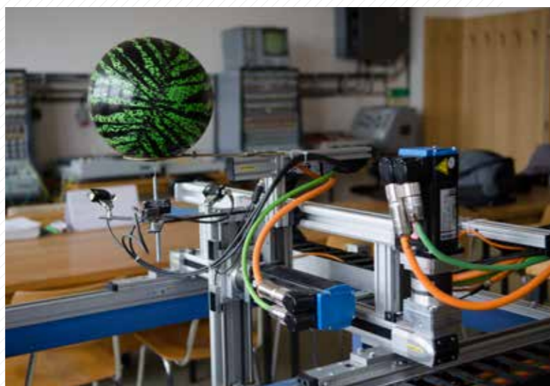
Robotický lachtan – portálový robot, který umí balancovat míč na jehle.