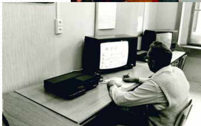
Ověřování možnosti využití videorekordéru ve výuce algebry na katedře matematiky.