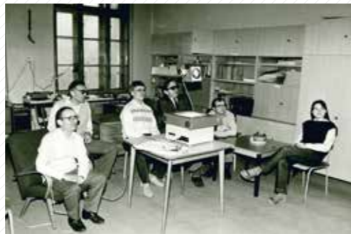
Odborný seminář na katedře matematiky.