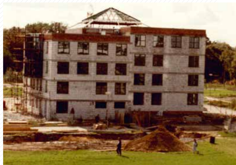
Výstavba rektorátu v roce 1995.