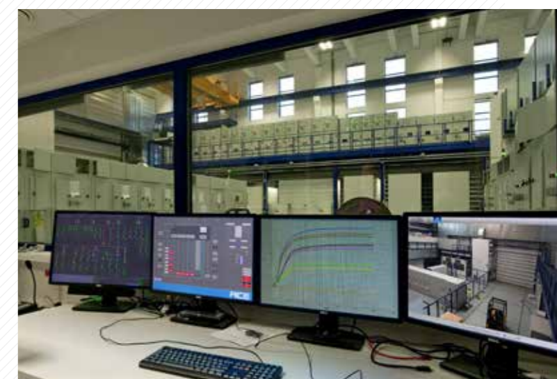
Halová laboratoř a zkušebna vysokonapěťové výkonové elektroniky a dopravní techniky v RICE.