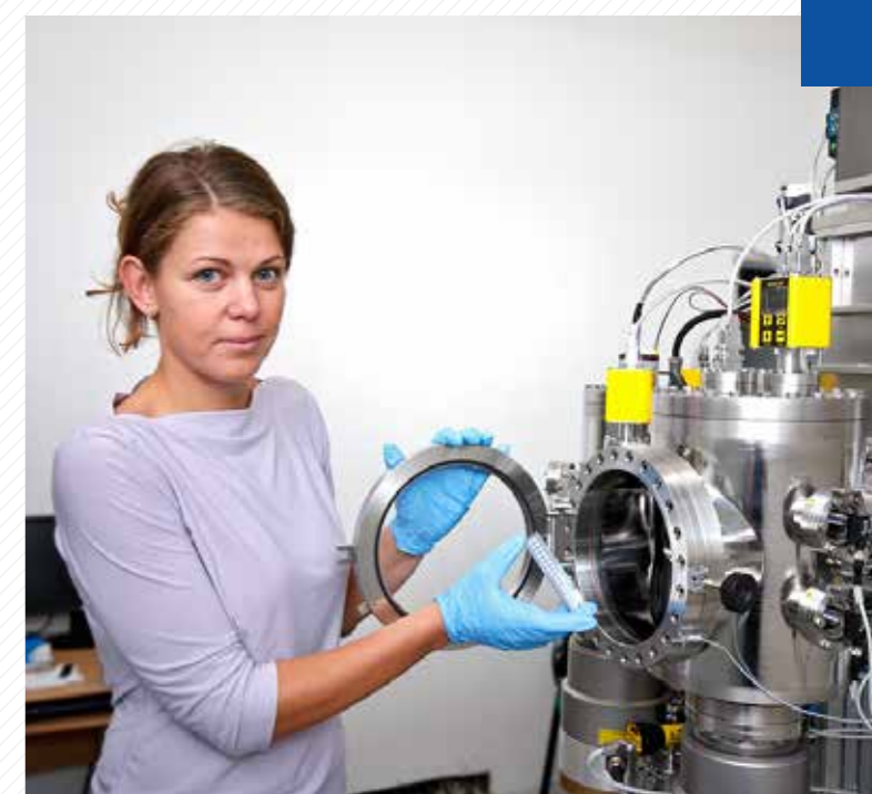
Unikátní pětikomorové naprašovací zařízení pro vývoj tenkovrstvých solárních článků PECVD.