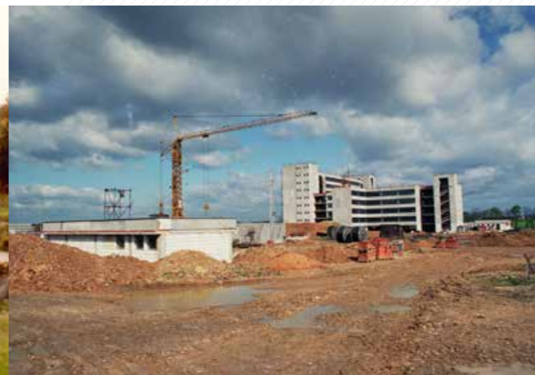
Stavba strojí fakulty a menzy.