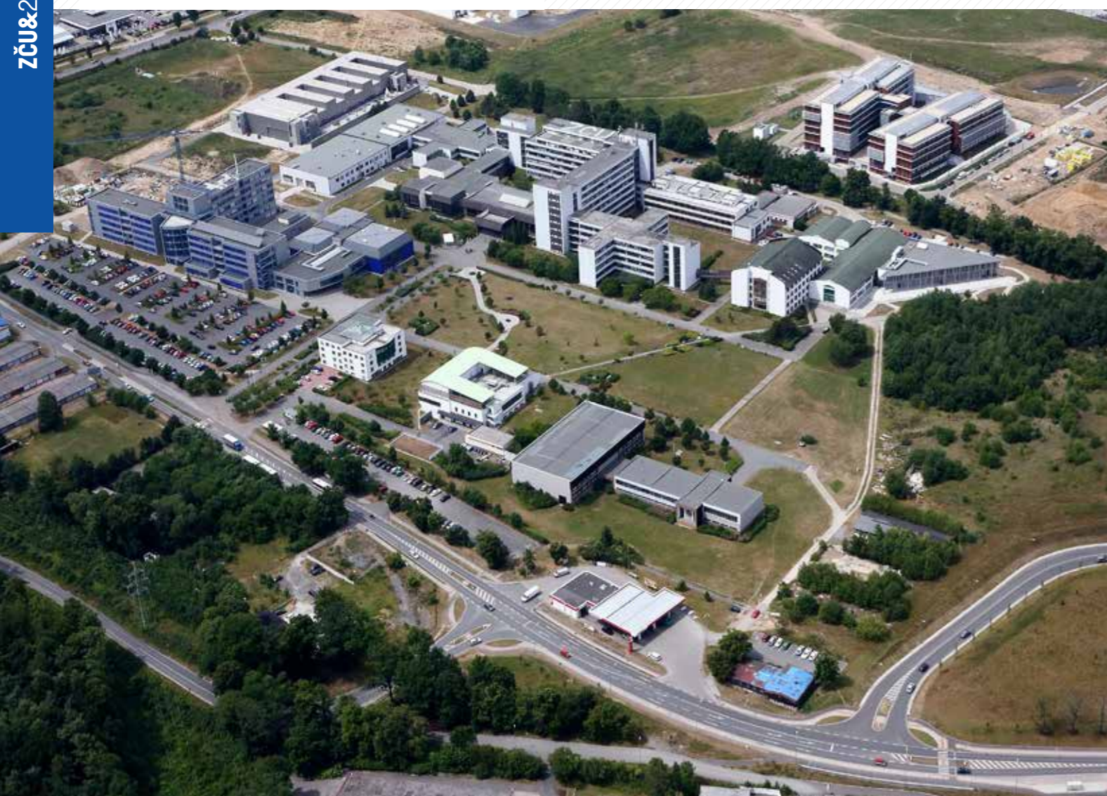
Pohled na univerzitní kampus z roku 2014.