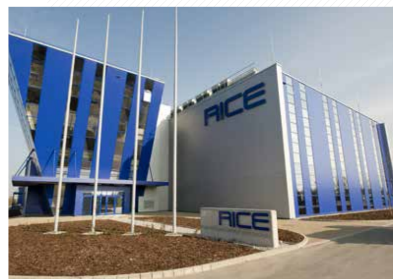
Nová budova výzkumného centra RICE byla otevřena v roce 2016.