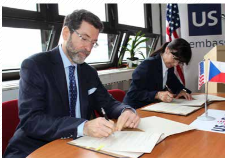
Otevíření US Pointu v roce 2013 za účasti velvyslance USA Normana L. Eisena.