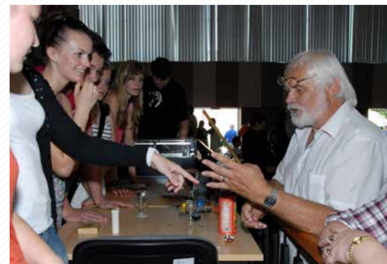
Pravidelná akce fakulty, Den s fyzikou, zahrnuje práci s talentovanými studenty.