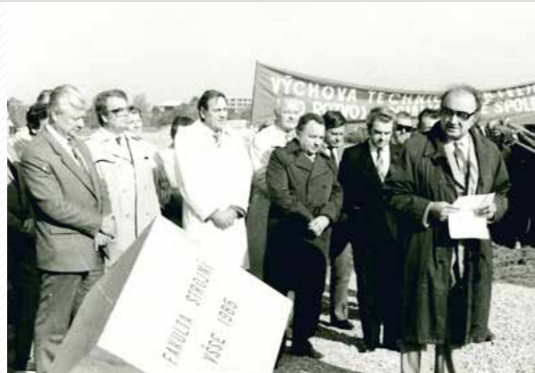
Poklepání základního kamene v roce 1985 – zahájení výstavby nejen strojí fakulty, ale i celého univerzitního kampusu.

Po svém vzniku působila univerzita na řadě míst po celé Plzni. Fakulty sídlily a vyučovaly v mnoha pronajatých i vlastních prostorách a roztržitost výuky byla vnímána jako jednoznačná překážka. Z tohoto důvodu vznikl záměr koncentrovat výuku do právě vznikajícího areálu na Borských polích. Zelený trojúhelník, jak se místo pro univerzitu začalo nazývat, se měl proměnit v univerzitní městečko se všemi fakultami, sídlem rektorátu, univerzitní knihovnou, menzou a další infrastrukturou. Z velké části se tento záměr naplnil. Borská pole se od položení základního kamene v roce 1985 proměnila v univerzitní kampus, kde sídlí pět fakult, tři výzkumná centra, rektorát, menza a univerzitní knihovna. Na atraktivitě celého univerzitního městečka by měla určitě přidat tramvajová linka, jejíž prodloužení z konečné na Borech se plánuje.