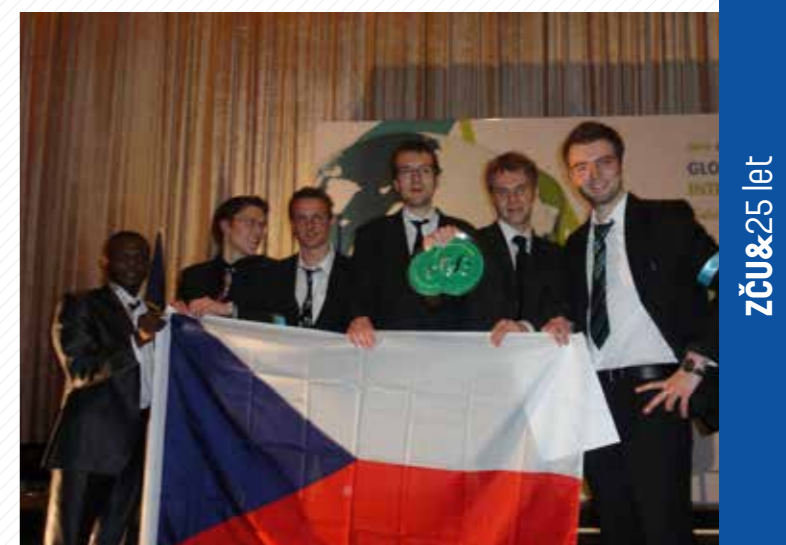
Studenti 4. ročníku se v roce 2011 umístili na 3. místě v celosvětovém finále prestižní soutěže v Hongkongu Global Management Challenge.