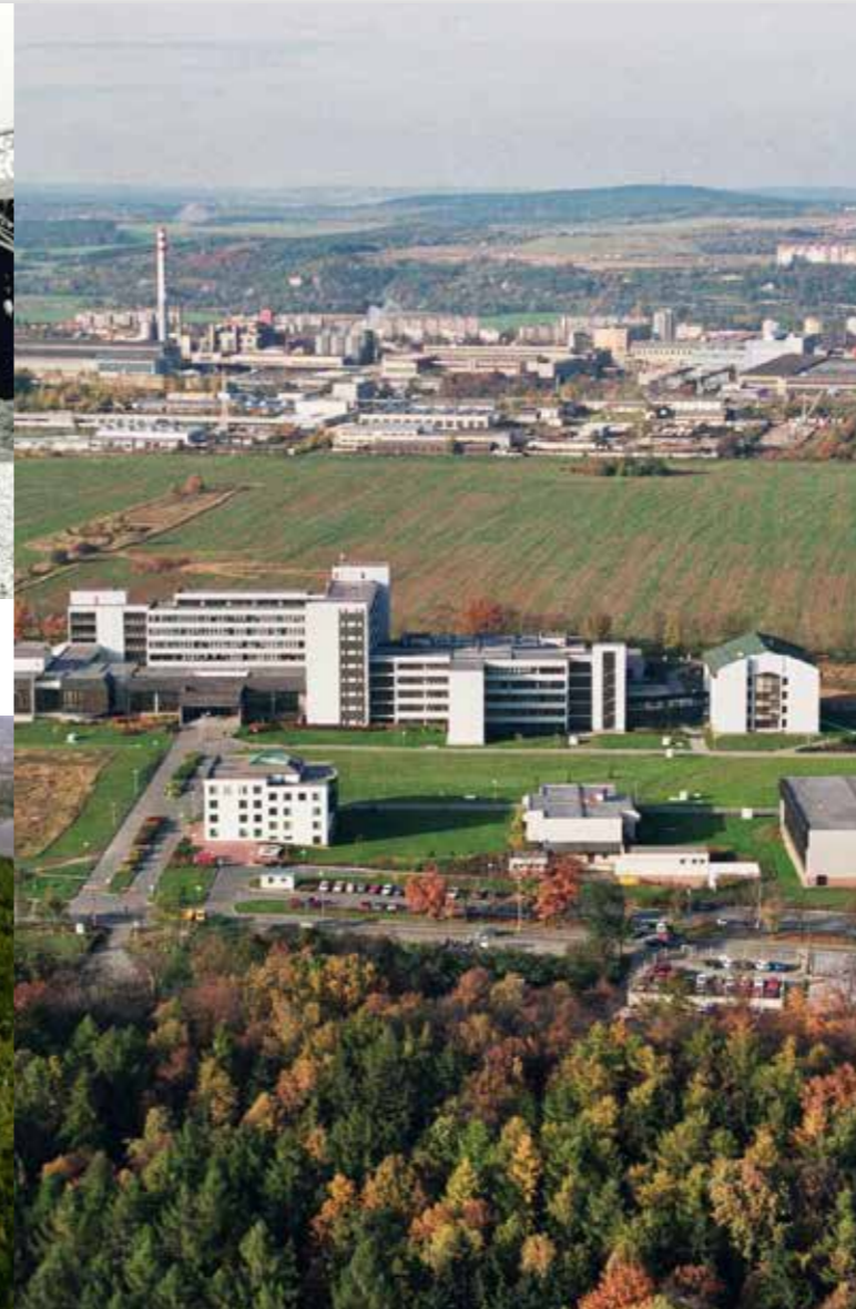
V roce 1998 již stojí budova strojí fakulty, rektorát, menza i tělocvična.