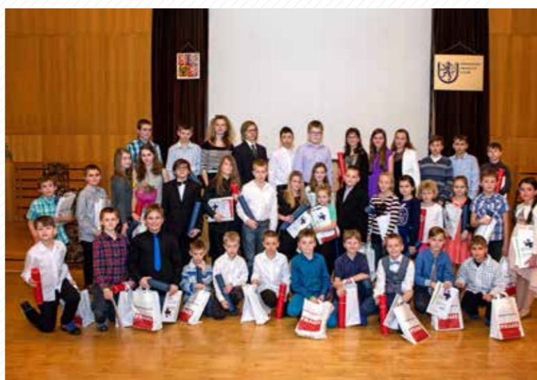
Při studiu na dětské univerzitě si žáci základních škol vyzkoušejí, jaké to je, studovat na vysoké škole.