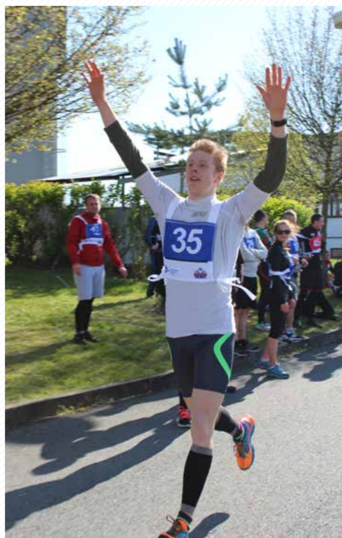
Dubnového sportovního klání, štafetového závodu Běh s rektorem, se zúčastnilo 52 dvojic z celé univerzity.

Celý rok 2016 se pak nese ve znamení kulturních, sportovních a společenských akcí, kterými studenti, zaměstnanci i široká veřejnost slaví 25 let od založení Západočeské univerzity v Plzni.