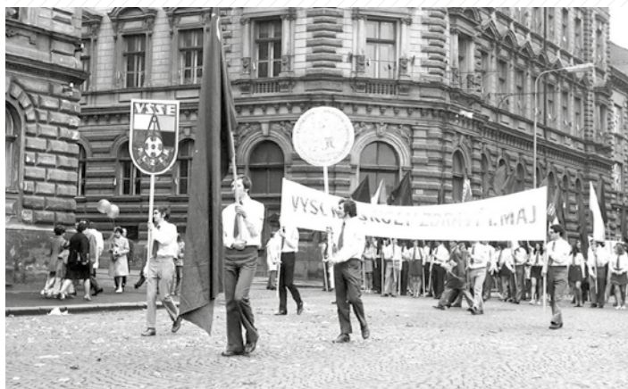
Oslavy 1. máje, sedmdesátá léta.