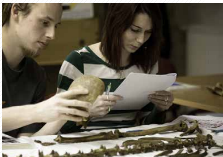
Oddělení biologické antropologie.