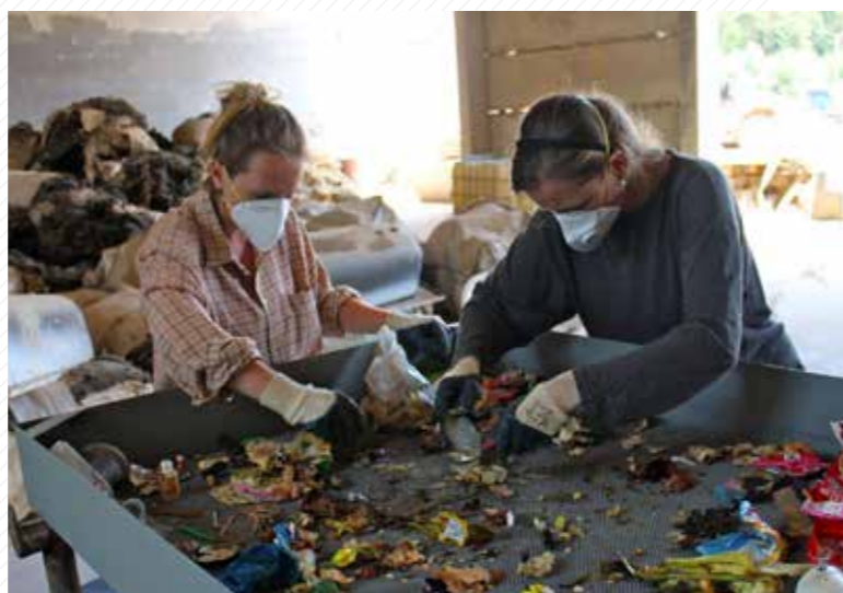
Katedra antropologie realizovala v roce 2013 garbologický projekt, zaměřený na studium soudobé společnosti prostřednictvím odpadu.