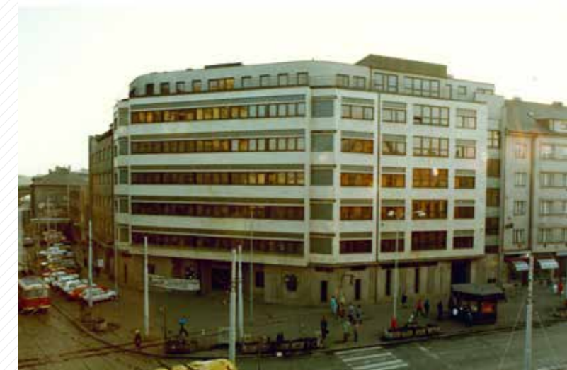
Fakulta sídlila v budově bývalého krajského výboru KSČ. Do současné se přestěhovala v roce 2006.

Právnická fakulta se řadí mezi čtyři fakulty českých veřejných vysokých škol, poskytujících právnické vzdělání. V současné době má akreditovaný magisterský studijní program Právo a právní věda (obor Právo), bakalářský studijní program Právní specializace (obor Veřejná správa), navazující magisterský studijní program Veřejná správa (obor Veřejná správa) a doktorský studijní program Teoretické právní vědy (obor Občanské právo). Na fakultě působí odborníci, kteří jsou známí nejen pro svoji skvělou teoretickou erudici, ale také pro svoji vynikající práci na poli legislativní a aplikační praxe. Mimo jiné zasedají v poradních orgánech vlády ČR, jsou nezřídka soudci, uznávanými advokáty, exekutory, rozhodci a insolvenčními správci.