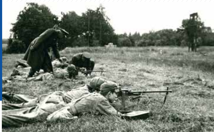
Do výuky patřil i vojenský výcvik.