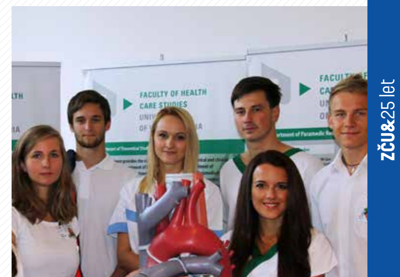
Fakulta spojená s pulsem života a pro život.