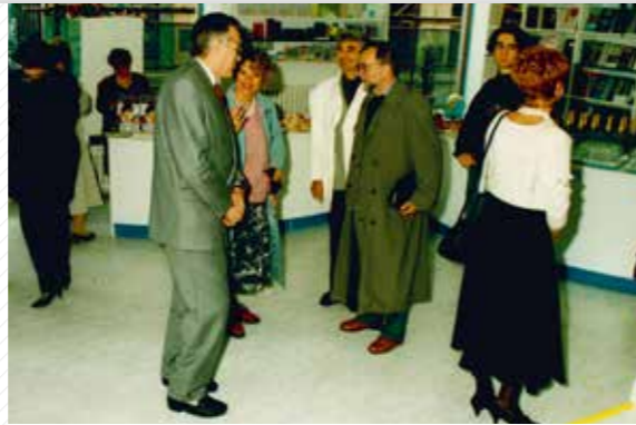
V roce 1994 se slavnostně otevřelo univerzitní knihkupectví v Sedláčkově ulici.