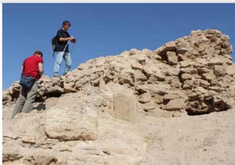
Mimořádný nález se podařil archeologům v roce 2013. V Kurdistánu objevili pozůstatky velkého města z předislámského období.

Filozofická fakulta rozšiřuje vzdělanost nejen svými studijními programy antropologického, filologického, filozofického, historického, humanitního a společenského zaměření, ale také prostřednictvím svých oborů přispívá ke kultivaci a humanizaci prostředí a napomáhá ke kulturnímu rozvoji regionu. Vědeckou a výzkumnou činností vytváří významné badatelské středisko a prostřednictvím svých disciplín umožňuje pochopit region, jeho minulost i současnost. Svou polohou v příhraničí nabízí navíc prostorové přesahy v oblasti badatelských aktivit i vzdělávání, které mohou navázat na tradici úzkých kontaktů západních Čech a jihovýchodního Německa.