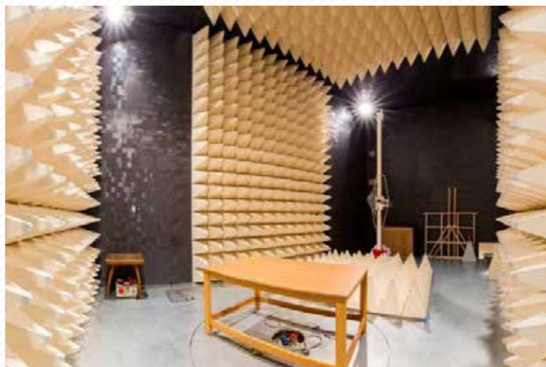
Laboratoř elektromagnetické kompatibility. Částečně bezodrazová stíněná komora je určena jak k měření elektromagnetického rušení zařízení, tak testování jejich odolnosti proti vysokofrekvenčním elektromagnetickým polím.