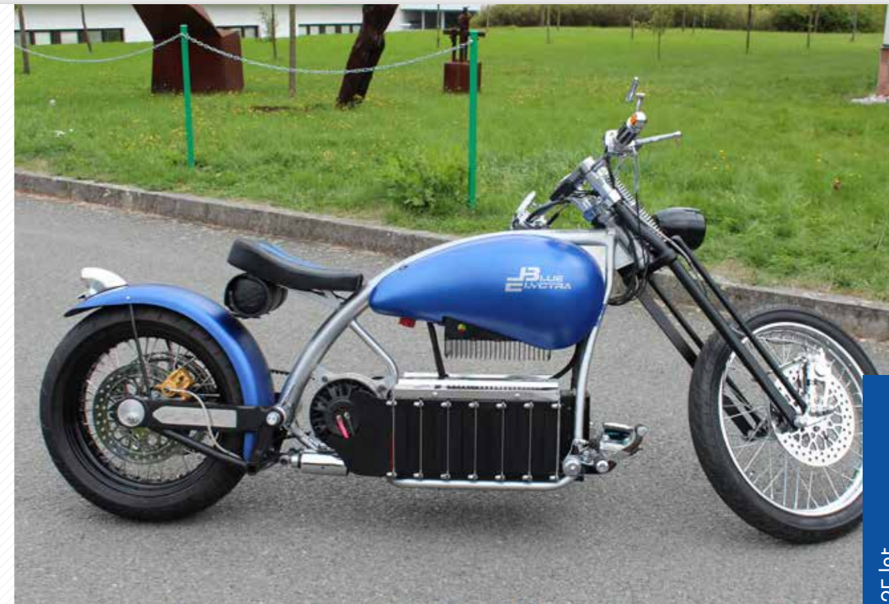
První český elektromotocykl ve stylu chopper vznikl na strojírní fakultě.

Odborníci z centra NTIS navrhuji materiály pro novou generaci leteckých motorů.