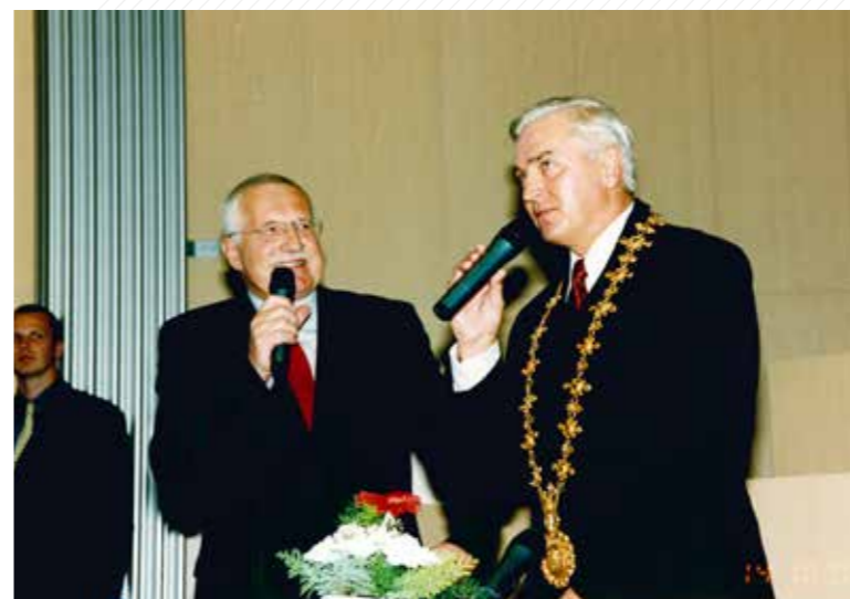
Rektor Zdeňk Vostracký přivítal na univerzitě v roce 2003 prezidenta Václava Klause.