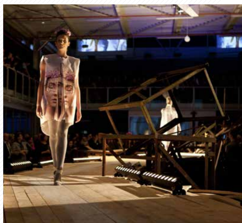
Budova Sutnarky se často mění v dějiště nejprestižnějších kulturních a společenských akcí.