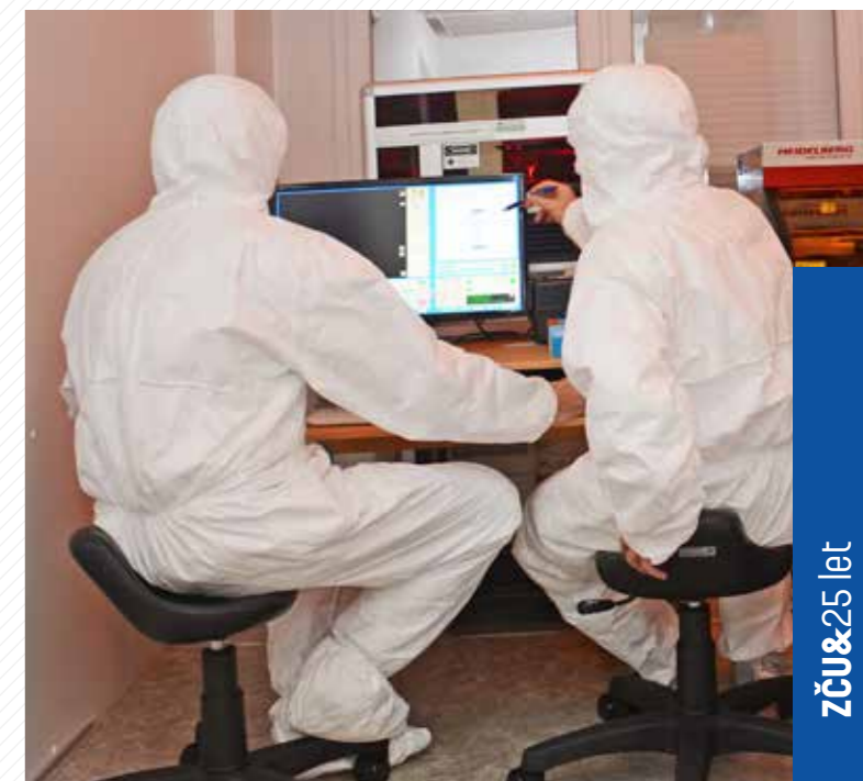
Čistá komora v laboratoři litografie.

NTC se zaměřuje na laserové a termovizní technologie pro průmyslové aplikace; vývoj nových materiálů, membrány, polymerní kompozity; modelování deformačních a dynamických procesů; měření a simulace proudění kapalin a přenosu tepla; vývoj tenkovrstvých materiálů pro fotovoltaiku, fotoniku a mikrosystémovou techniku; palivové články; uchovávání energie; měření biometrických signálů a modelování lidského těla či interakce-člověk stroj. Aplikace nacházejí uplatnění v mnoha zemích celého světa.