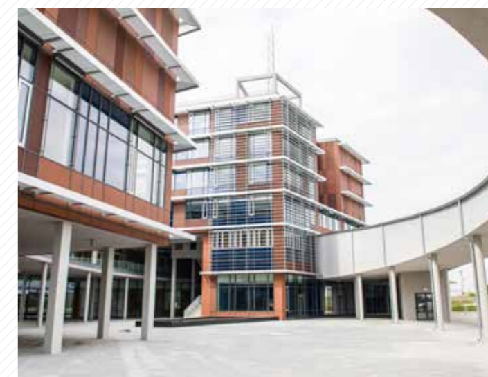
Budova výzkumného centra NTIS.

Regionální technologický institut je strojírenské a technologické výzkumné centrum strojírenské fakulty, které provádí výzkum a vývoj zaměřený především na moderní konstrukce vozidel včetně jejich pohonných systémů, výrobní stroje včetně jejich modernizací, tvářecí a obráběcí technologie.