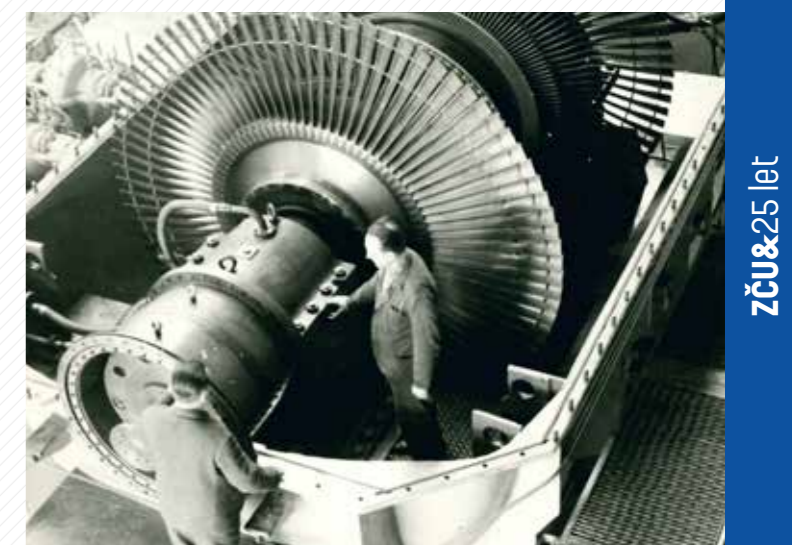
Výzkum proudění páry v průtočných systémech parních turbín v OP Škoda, na kterém se podíleli pracovníci VŠSE v osmdesátých letech.