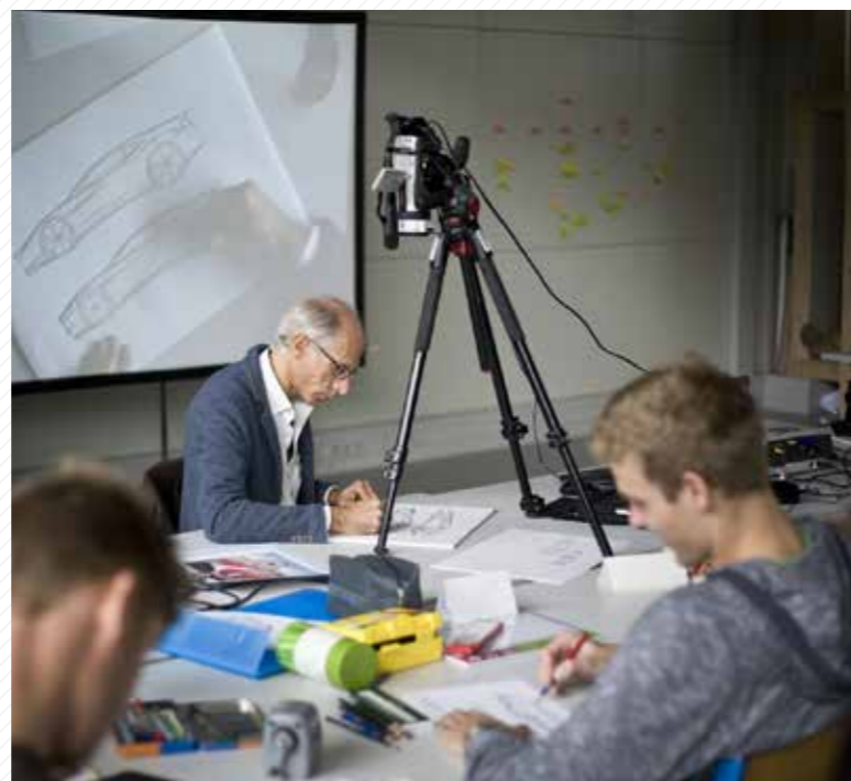
Studenti Sutnarky často pracují pod vedením renomovaných zahraničních umělců – na snímku designér vozů Ferrari Maurizio Corbi.

Fakulta designu a umění Ladislava Sutnara je moderní umělecká škola, jejíž studenti získávají pod vedením řady významných českých umělců bakalářské a magisterské vzdělání v širokém spektru oborů zaměřených na výtvarné umění, zejména na design a užité umění. Jak název napovídá, škola svojí činností a filozofií navazuje na inspirativní odkaz významného plzeňského rodáka a geniálního designéra Ladislava Sutnara. Sutnarka působí v moderní originálně koncipované budově, kde se každoročně koná mimo jiné i mezinárodní letní škola umění ArtCamp a další umělecké kurzy pro veřejnost. Fakulta dále provozuje Galerii Ladislava Sutnara a další výstavní prostory, každoročně udílí prestižní Cenu Ladislava Sutnara, pořádá soutěž pro studenty středních škol Teendesign a spolupracuje s řadou českých i zahraničních kulturních a vzdělávacích institucí.