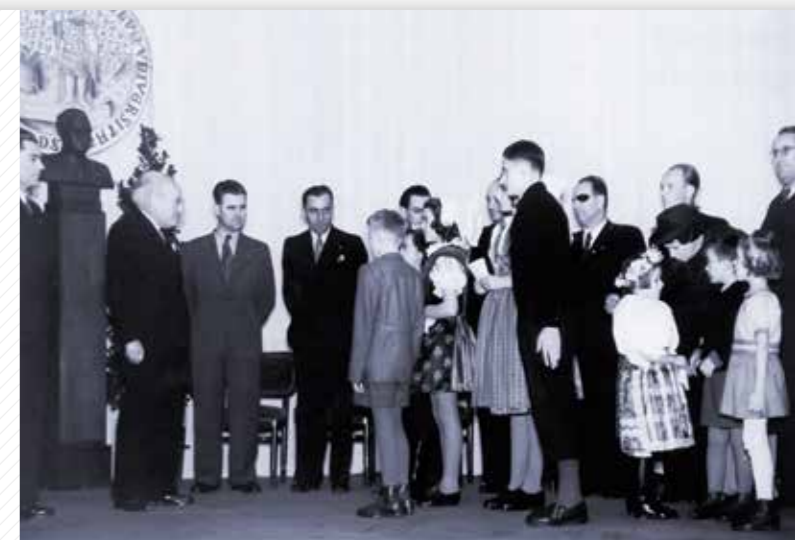
Slavnostní otevření pedagogické fakulty se konalo 14. 11. 1948 ve velké dvoraně tehdejší Slovanské besedy.

Za celou dobu svého trvání vypravila fakulta do života téměř 25 000 absolventů. Pracovníci fakulty jsou autory mnoha skript, publikací a učebnic pro základní, střední a vysoké školy, řada z nich získala prestižní ocenění na mezinárodních knižních veletrzích. Fakulta při přípravě učitelů spolupracuje s mateřskými, základními a středními školami v Plzeňském a Karlovarském kraji. Pedagogická fakulta vydává vědecký časopis Arnica a praktický časopis Školská fyzika. Ve vědecké, výzkumné a projektové oblasti se pracovníci fakulty zaměřují zejména na modernizaci metod a forem výuky na všech typech škol.