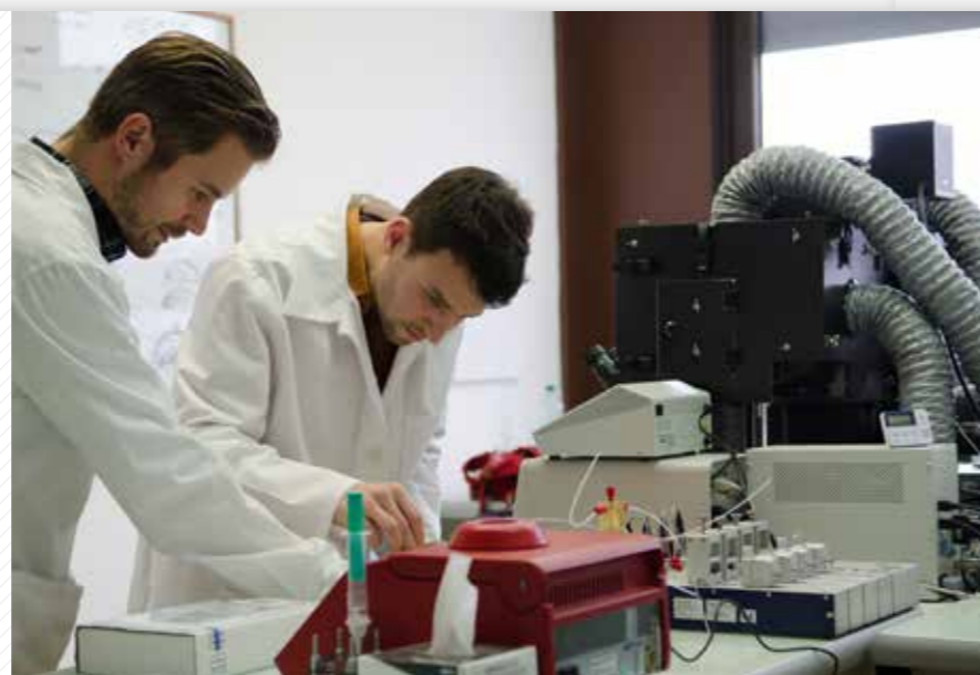
Biokybernetická laboratoř ve výzkumném centru NTIS. Příprava modifikovaných buněk pomocí nástrojů syntetické biologie.

Univerzitě se podařilo vybudovat čtyři výzkumná centra v rámci operačního programu Výzkum a vývoj pro inovace, která se svými výsledky slaví úspěchy daleko za hranicemi republiky.