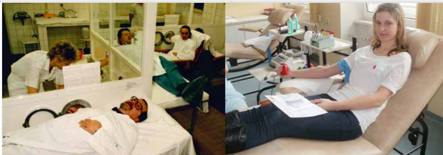
Kýbl akademické krve pořádá od roku 1993 ekonomická fakulta v Chebu.