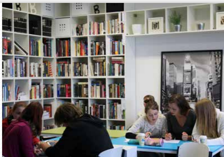
Americké centrum US Point.

Ústav jazykové přípravy poskytuje jazykovou výuku studentům všech fakult ZČU v bakalářských i magisterských studijních programech a v některých doktorských programech. Jazyky učí také v rámci Univerzity třetího věku a v kurzech celoživotního vzdělávání, nabízí mezinárodně uznávané jazykové zkoušky a přípravné kurzy. Angličtinu a ruštinu si studenti i široká veřejnost mohou zábavnou formou procvičit i zdokonalit v kulturně jazykových centrech US Point a Ruské centrum. Ústav je členem mezinárodních organizací sdružujících evropská jazyková centra a podílí se na mezinárodních jazykových projektech.