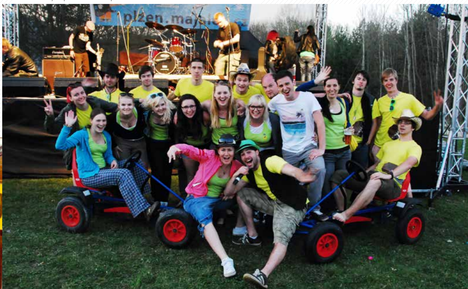
Festival studentských kapel Kapeláž se koná vždy na jaře v areálu kampusu.