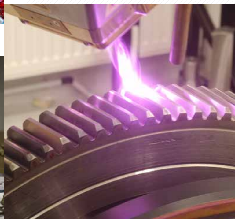
Ukázka laserového kalení.