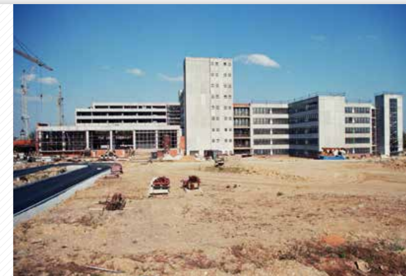
Stavba budovy strojní fakulty.

vypracován investiční záměr na výstavbu nového areálu VŠSE na Borských polích