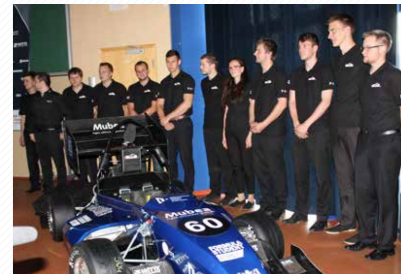
Studentská formule je příkladem mezifakultní spolupráce studentů z pěti fakult.