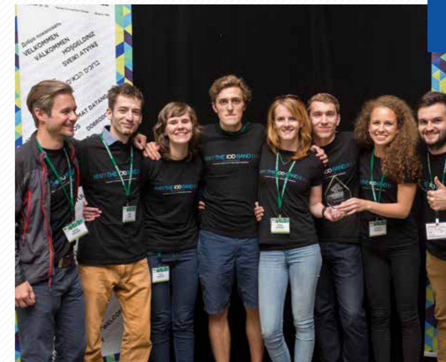
Výzkumný tým z NTIS získal v roce 2015 osm medailí v Bostonu za metodu, která umožní diagnostiku dynamiky rakovinných buněk.