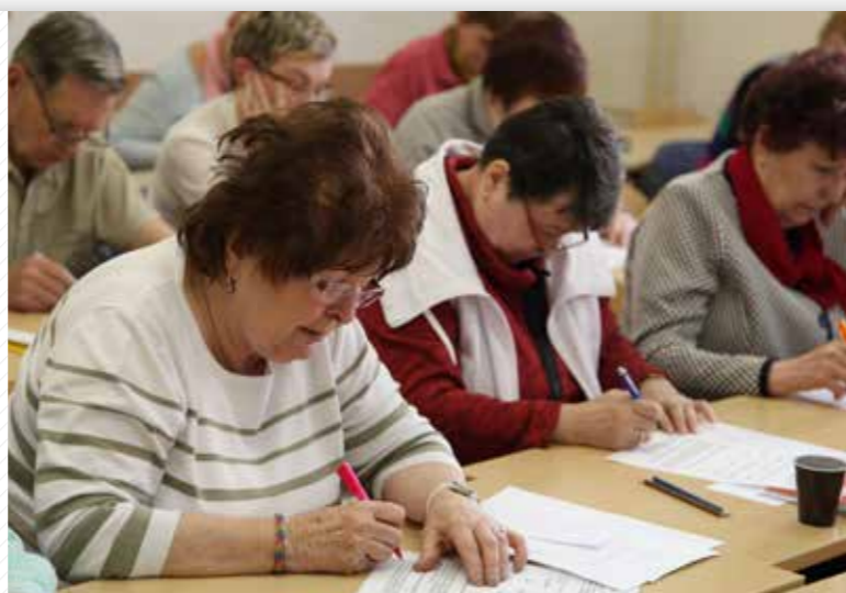
Univerzita třetího věku je určena všem seniorům, kteří mají chuť se dále vzdělávat.

Stejně oblíbená je i Dětská univerzita , kterou pořádá od roku 2014 pedagogická fakulta. Pro žáky základních škol a nižších ročníků gymnázií je to výborná příležitost seznámit se s vysokoškolským prostředím a zároveň možnost využít svůj volný čas k získávání zkušeností a vzdělání.