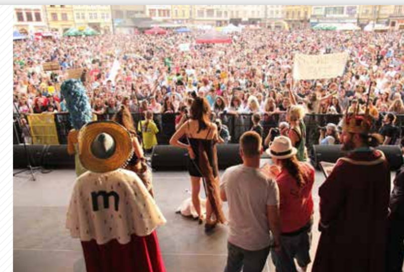
K tradičním studentským akcím patří Majáles.