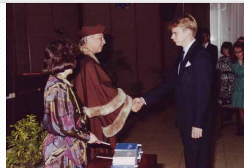
Promoce prvních absolventů v Chebu v červenci 1993.

Ekonomická fakulta se také výrazně angažuje ve studentské mobilitě. Má uzavřeno více než 50 partnerských smluv v 17 zemích Evropy a šest smluv s univerzitami na asijském i americkém kontinentu. Možnosti studentské mobility nabízí studentům na speciálně vytvořeném webu. Již 20 let trvá spolupráce s Marquette University v americkém městě Milwaukee. V létě 2016 se ekonomická fakulta přestěhovala z centra města do nově zrekonstruovaných prostor v univerzitním kampusu, což je všeobecně vnímáno jako možnost pro její hlubší integraci v rámci ZČU.