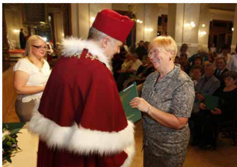
Součástí studia na Univerzitě třetího věku je i slavnostní promoce.